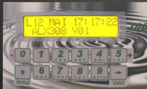
Saisie d'un véhicule