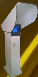
Version avec plinthe et canopy