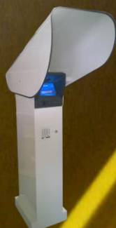
Version avec plinthe et canopy