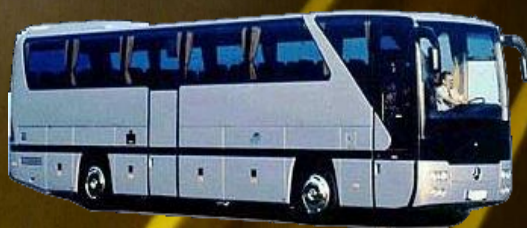
Vehículo equipado de un TX008

fecha / conductor / vehículo / kilometraje / volumen / producto.