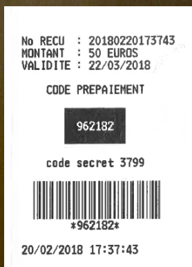
Exemple de ticket