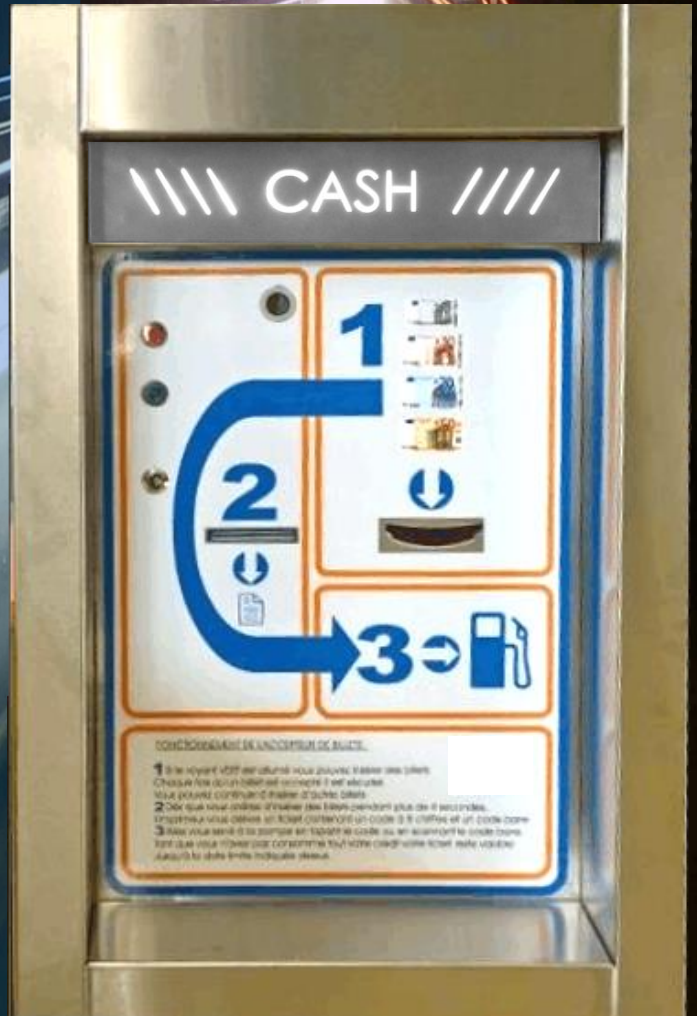
Accepteur de billets