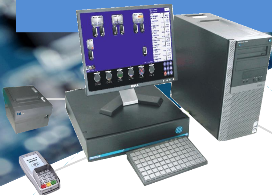
PL004 avec option TPE, imprimante ticket et clavier spécialisé