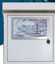
Intégration dans boîtier mural