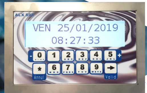
Façade numérique (existe en version anti-vandale)