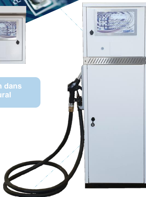
Intégration dans distributeur