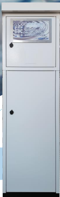
Intégration sur pied borne