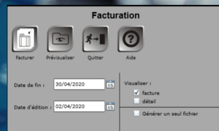
Lancement de la facturation

Le module client en compte permet la facturation / dé-facturation. Chaque facture peut être associée à une facture détaillée. La facturation est lancée de date à date au choix du responsable