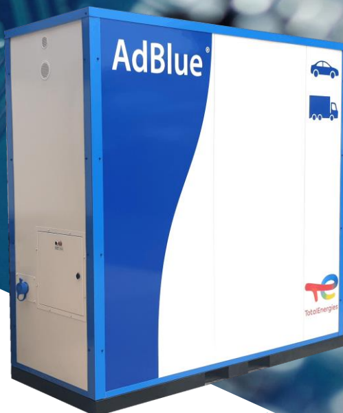
Exemple de personnalisation